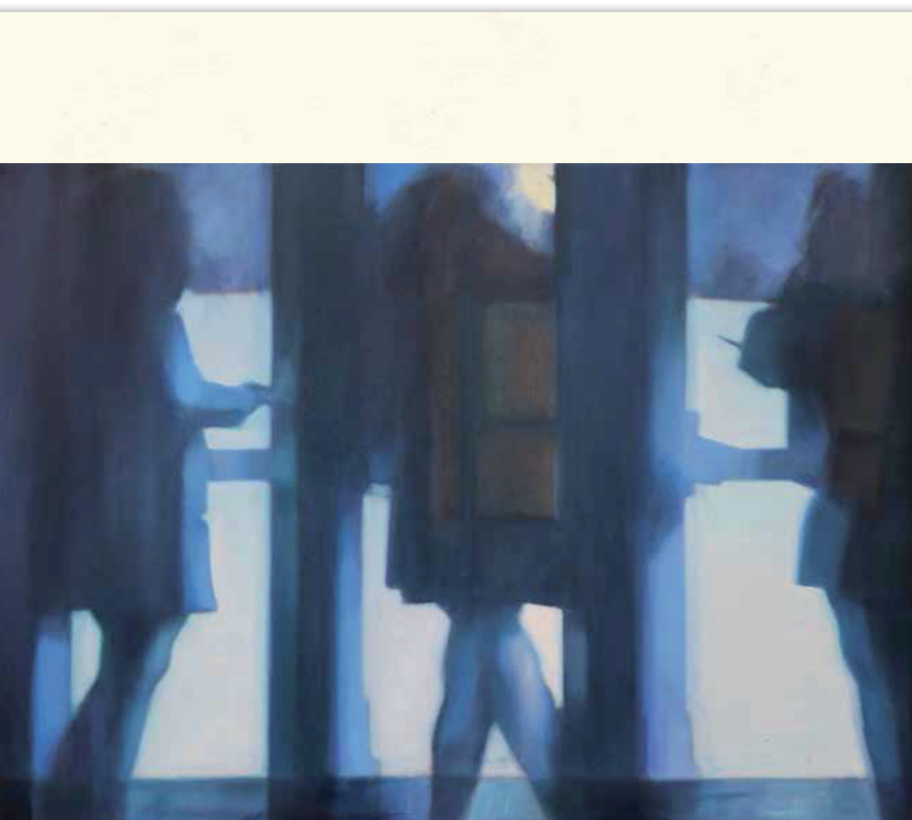
R.M. Rilke aan zijn Poolse vertaler, in een toelichting bij Duineser Elegien :